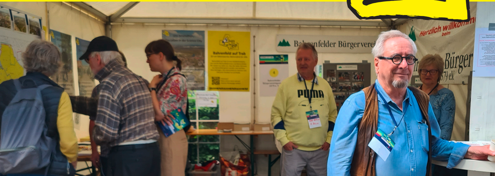
Auf dem Science Day am 1. Juni hatte Bahrenfeld auf Trab gemeinsam mit dem Bahrenfelder Bürgerverein von 1879 einen Infostand.